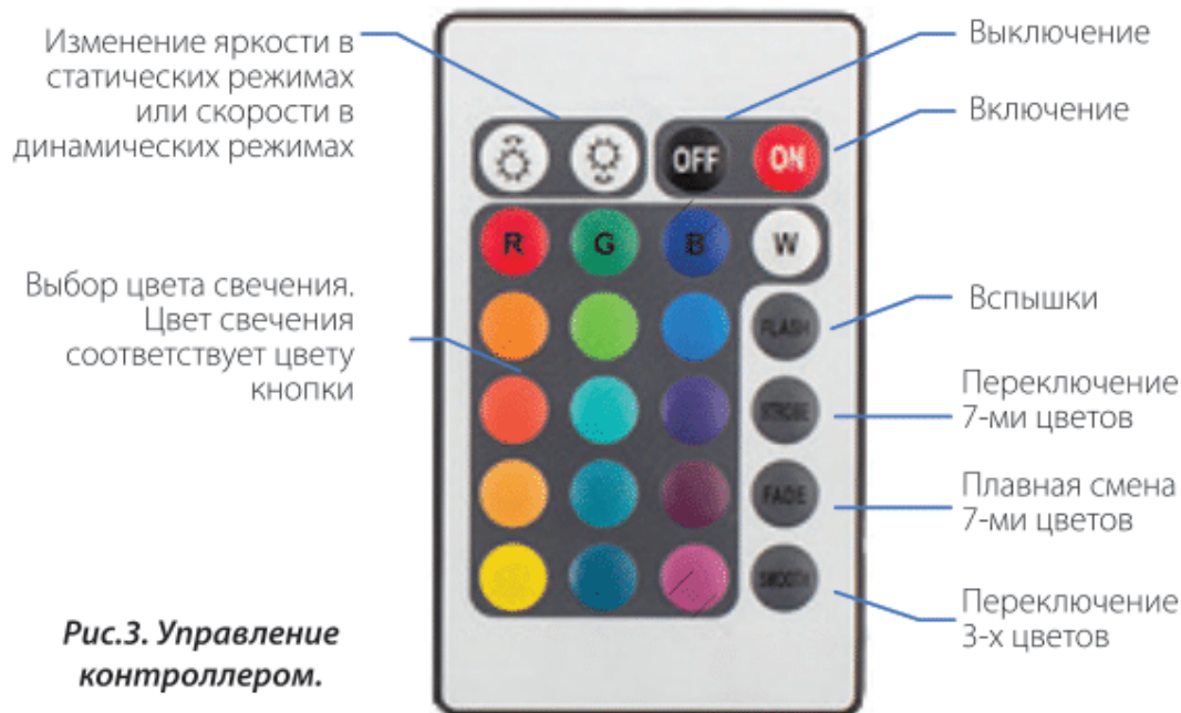
Рис.3. Управление контроллером.